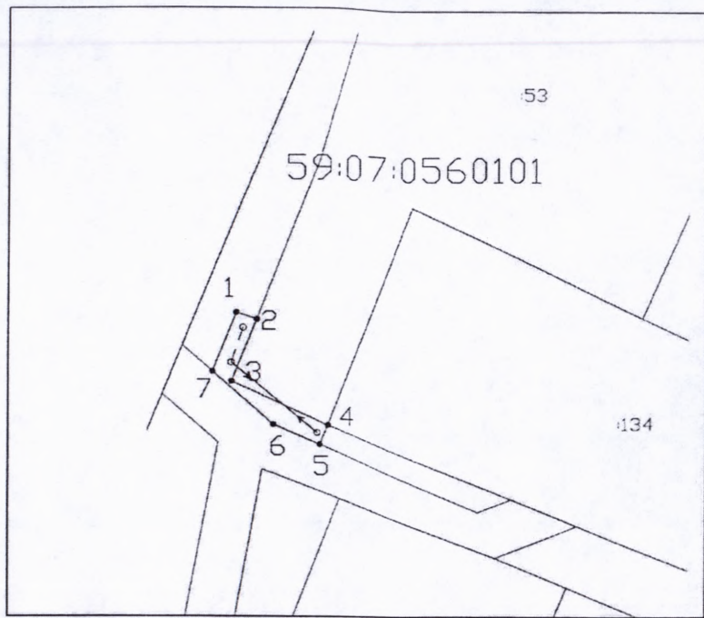
Схема предполагаемых к использованию земель или части земельного участка