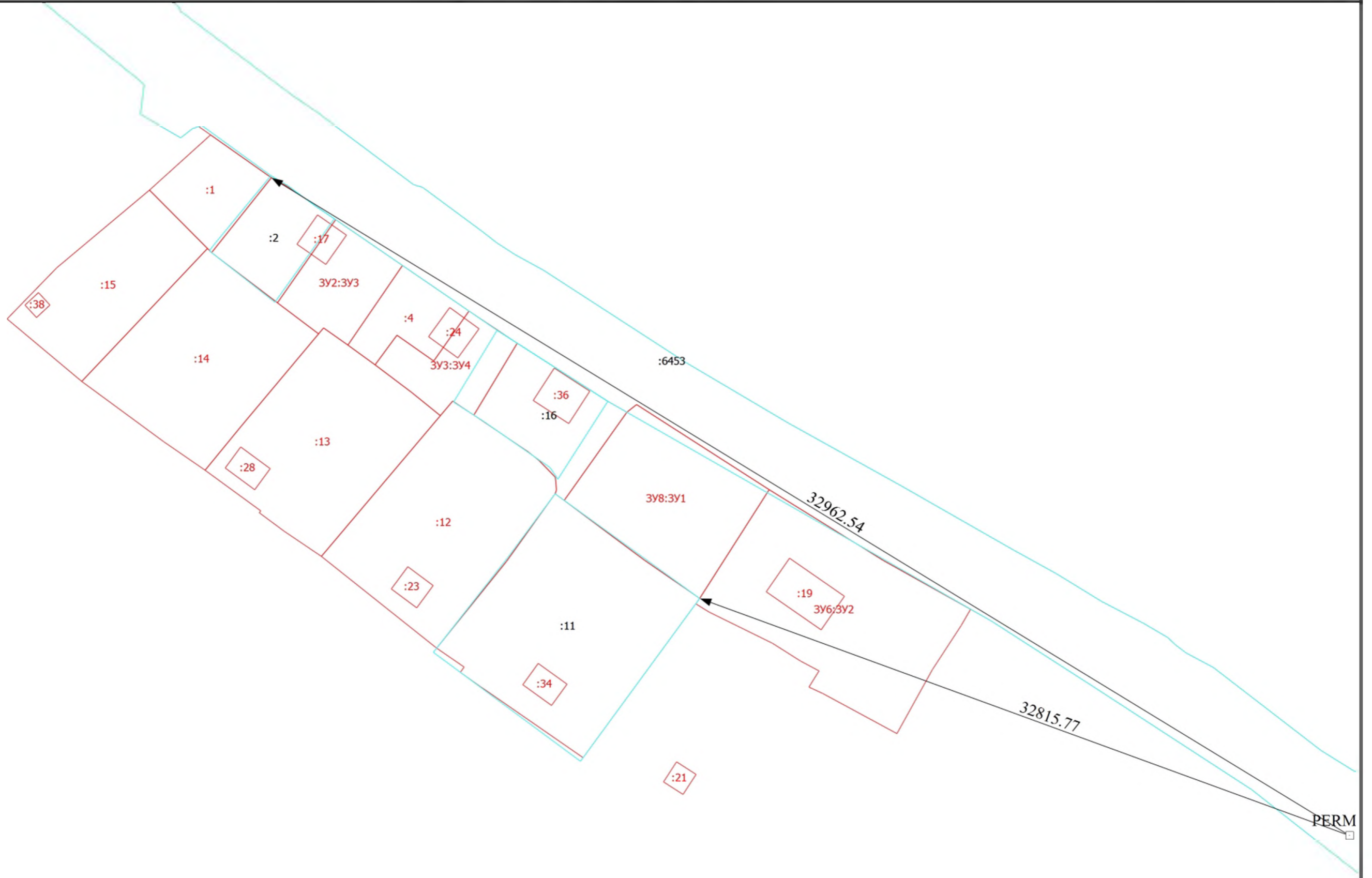
Схема геодезических построений